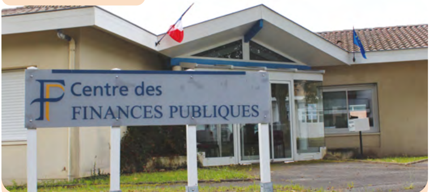
Le nouveau siège du bureau tyrossais du Trésor Public, à proximité de l'Espace Grand Tourren et de la future Maison France Services

L'après-midi : les lundi, mardi & jeudi de 13h30 à 16h15, le mercredi de 14h45 à 17h30, le vendredi de 13h30 à 15h15