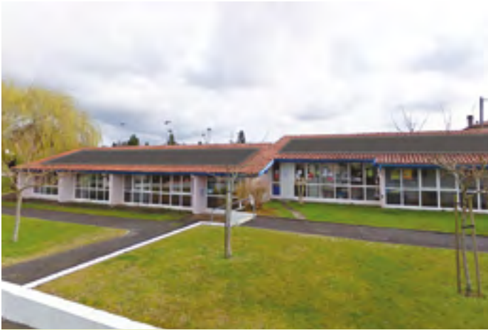
Simulation par ALOé d'une centrale photovoltaïque sur le toit du Centre Tourren.

ÉNERGIE - La Loi « Transition énergétique pour la Croissance Verte » de 2015 impose aux collectivités territoriales la production d'énergies renouvelables à hauteur de 30 % au moins de la production nationale d'électricité à l'horizon 2030. C'est pourquoi la Ville a mis à disposition de la société citoyenne ALOé les toitures de bâtiments communaux pour la création de quatre centrales photovoltaïques.