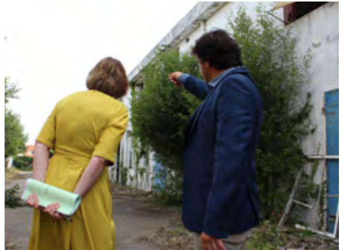
Mme la Préfète, en visite sur notre commune le 7 juin, découvre la friche et exprime son intérêt pour le projet.

La Commission d'Appel d'Offres, accompagnée par la SATEL*, a analysé et classé chacune des cinq offres selon un critère de prix (40 % de la note attribuée) et de qualité technique (60 % de la note attribuée). L'organisation de l'équipe, la méthodologie et le calendrier proposés, la compréhension des enjeux, des problématiques et des spécificités du projet... ont été minutieusement analysées afin d'attribuer une note technique à chaque prestation.