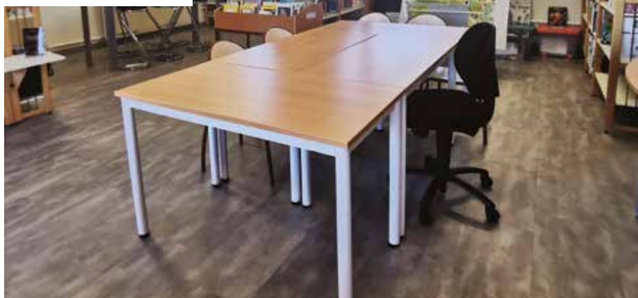
Les locaux de l'Atelier Canopé 40 entièrement réhabilités.

Alors qu'il n'a fait l'objet d'aucune amélioration depuis les années 1980, à l'issue d'une phase d'étude d'aménagement des espaces le bâtiment est en cours de réhabilitation. Le service Bâtiments municipal procède depuis septembre à un réaménagement intérieur complet, ainsi qu'à la réhabilitation de l'installation