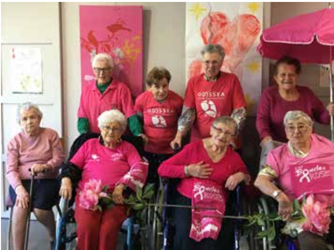
Les résidents de l'EHPAD ont confectionné des pastis qui ont été vendus au profit de l'action.

SOLIDARITÉ – Inaugurées en 2019, les «Boucles Roses de Semisens» témoignent un peu plus chaque année de la générosité et de l'engagement des Tyrossaises et Tyrossais en faveur des causes caritatives. Cette troisième édition, baptisée « Les Boucles roses à ma guise ! », s'est déroulée durant tout le mois d'octobre dans l'écrin du Bois de Fontaine, réunissant près de 530 participants et permettant de récolter 5802 € !