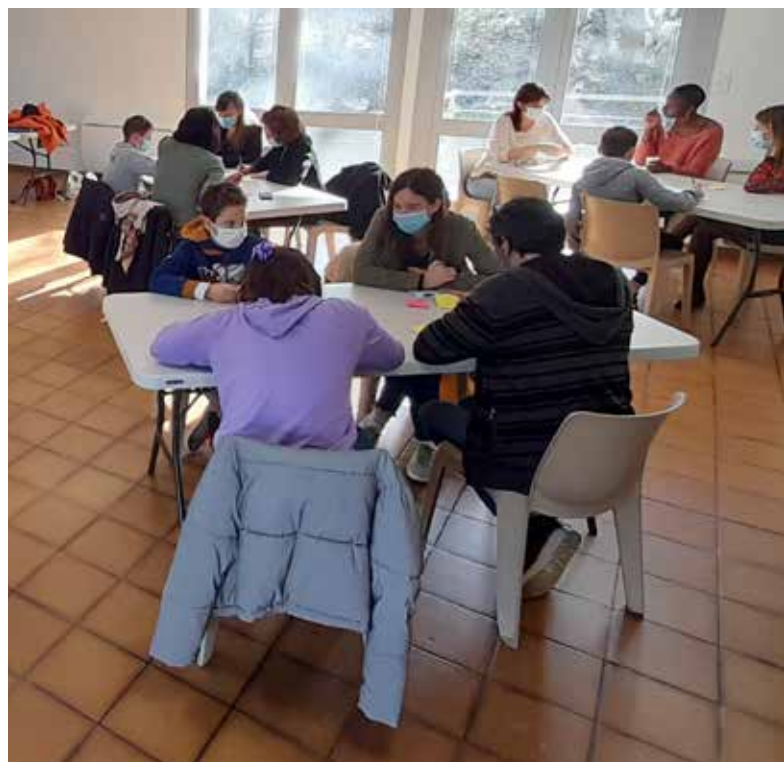
Groupes de travail au cours de la phase de diagnostic.